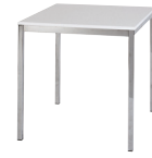
Maße: klein (70 x 72) groß (110 x 72)