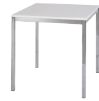
Maße: klein (70 x 72) groß (110 x 72)